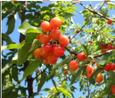
さくらんぼ狩り イメージ