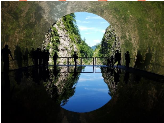
清津峡溪谷トンネル イメージ